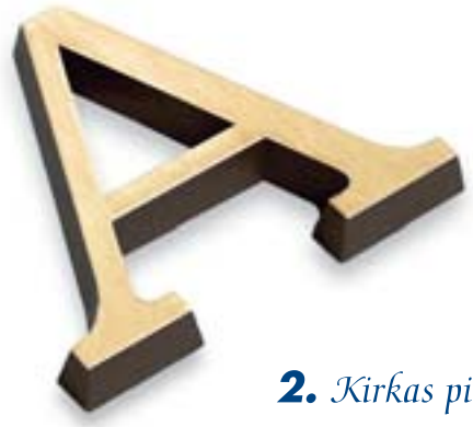
2. Kirkas pinta