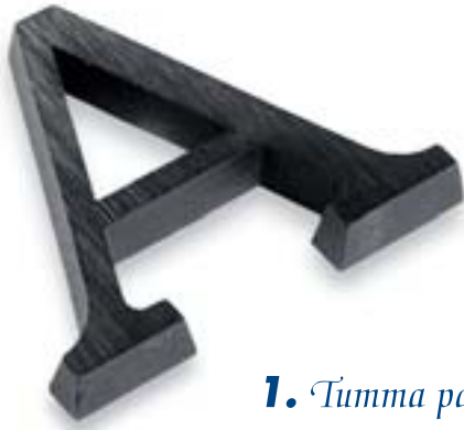
1. Tumma patina